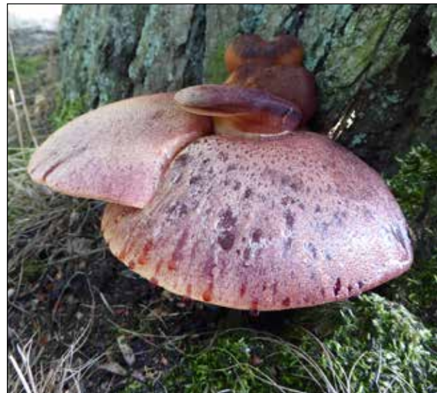
Biefstukzwam – Fistulina hepatica Wordt tot 20 cm groot. Tong tot balkonvormig. Kleur: roze tot vleeskleurig bruin, als hij jong is scheidt hij bloedrode druppels af. Onderzijde heeft wit/gele buisjes. Komt voor aan de voet van levende bomen, o.a. Eik, Tamme kastanje. Is een parasiet.