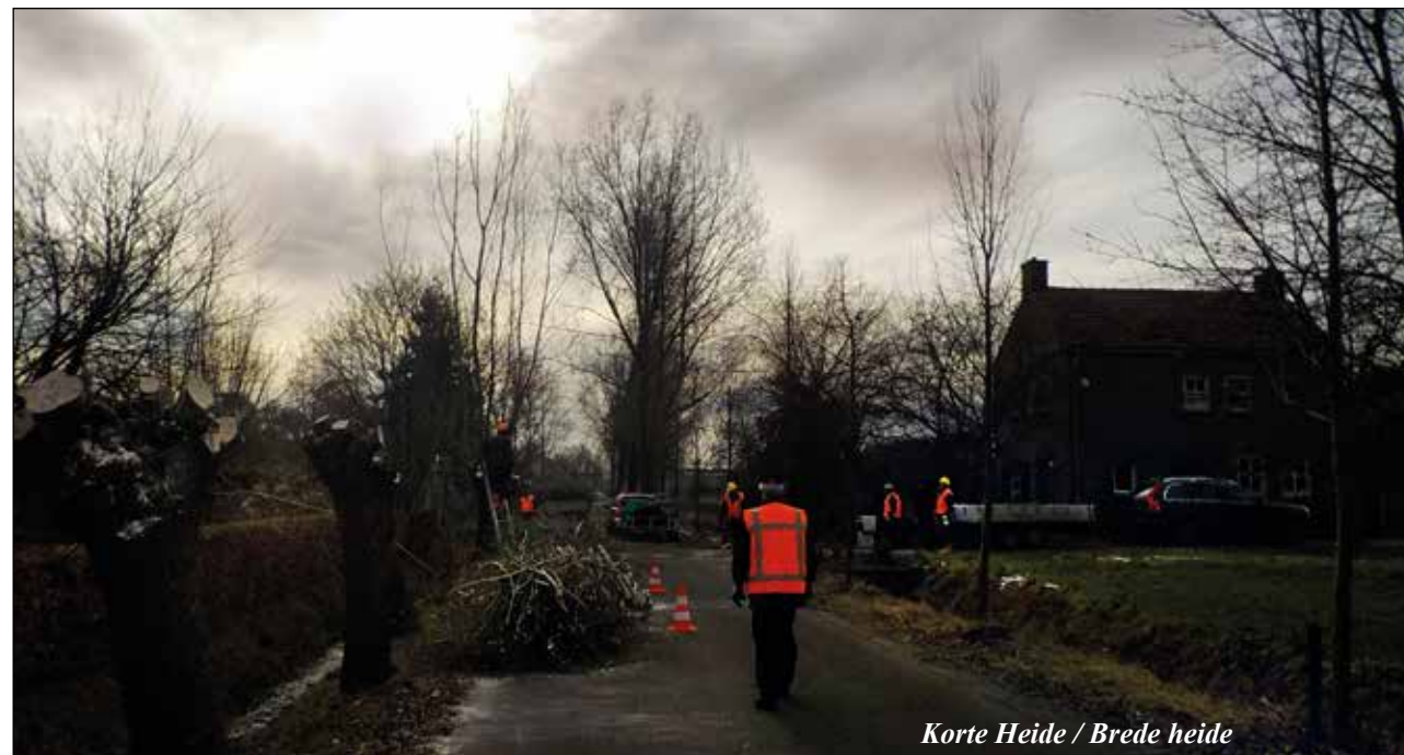
Korte Heide / Brede heide

En zo komen we op een totaal aantal uren dat weer hoger is dan dat van vorig jaar. Geen wonder dat we hard toe waren aan onze zomerstop!