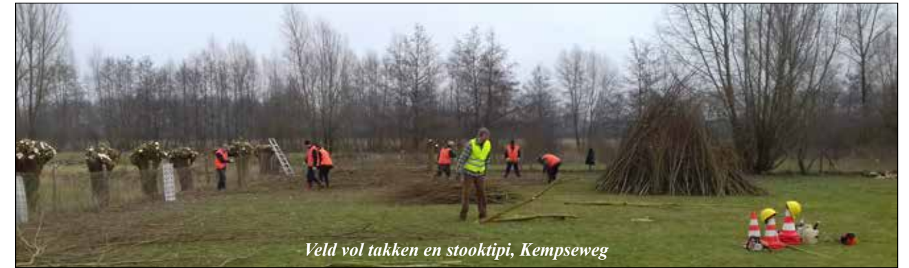
Veld vol takken en stooktipi, Kempseweg

Het grote hout werd apart gelegd voor de eigenaar als kachelhout, het dunne werd verwerkt in de houtril langs de wei of op een mooie tipi verwerkt en later opgestookt of met een (kleine) aanhanger toch maar naar de milieustraat gebracht! Ook de dierentuin in Hilvarenbeek kwam weer een deel van het takhout ophalen om te voeren aan de olifanten.