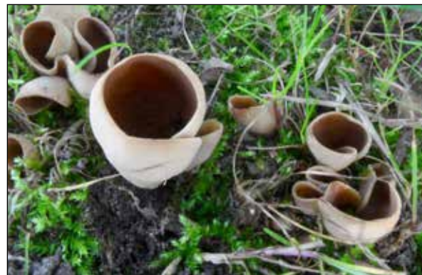
Zeemkleurig hazenoer – Otidia alutacea Kelk tot bekervormig. Aan een zijde ingesneden vaak in bundels. Voorkomen in loof en naaldhout.

We hebben in dit gedeelte al weer meerdere leuke soorten gevonden.