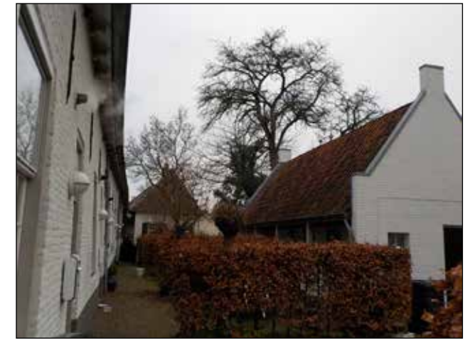
8 en 9: doorzicht tuin van 't Hofje' met de oude hoge fruitboom en de magnolia die behouden zijn gebleven.

Boombeleid is een zaak van heel lange adem! Zelfs als wij er niet meer zijn kunnen bomen zorgen voor adem- en leefruimte voor wie na ons komen. De (voor ons) juiste boom op de (voor hem) juiste plek plaatsen, waar hij JAAAREN kan blijven staan, en daar rekening mee houden bij het ontwikkelen van ruimtelijke plannen, dat is pas echt duurzaam bezig zijn en vooruitkijken!