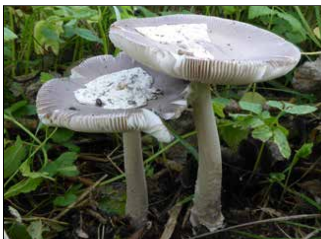
Grijze slanke amaniet – Amanita vaginata Grijs tot grijsbruin van hoed. Steel wit of grijsig. In loof en naaldbossen. Rode lijst: (Kwetsbaar)