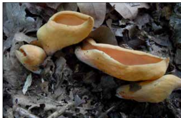
Gewoon varkensoor – Otidia onotica Meestal opgericht oorvormig, soms oranje aangelopen aan de binnenzijde. Voorkomen in loof en gemengde bossen. Rode lijst: (Kwetsbaar)