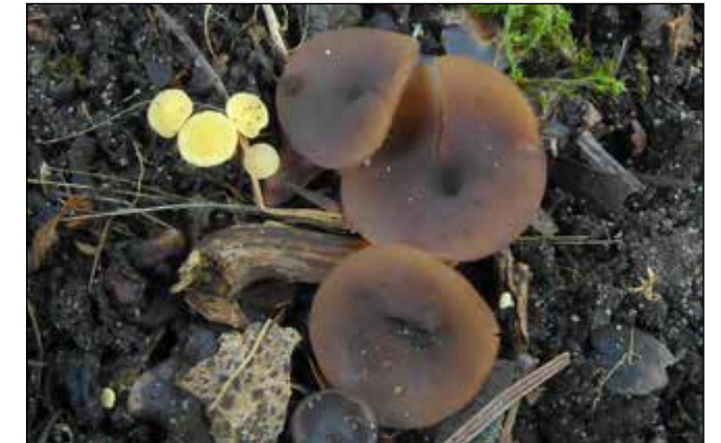
Eikelbekertje – Ciboria butschiana en Eikeldopzwam – Hymenoscyphus fructigenus Komt voor op overjarig vruchtvlies van eikels die afgevallen zijn en zijn donkerbruin. Komt voor op vruchtschalen van eikels en napjes van eikels, beukendoppen en hazelnoten.