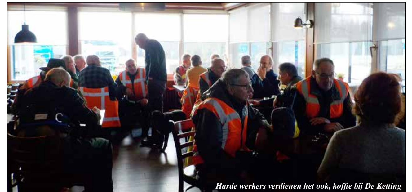
Harde werkers verdienen het ook, koffie bij De Ketting

Achterbergstraat, Bosrand 2, Geelders 2 en 4, Heult 18, Kalksheuvel 26, Kapelweg 51, Kempseweg 7a, Brede Heide/ Korte Heide 2 (2x), Korte Steeg 2, Lambertusweg 4, Mijlstraat 141, Rond 26, Selissen 9, Velderswegje 1. ➤