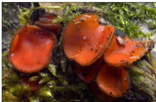
Gewone wimperzwam – Scutellinia scutellat Vlak schotel tot schijfvormig. Binnenzijde oranjerood. Buitenzijde met tot twee mm lange bruinzwarte haren, die boven de rand uit steken. Algemeen op vochtig en rottend hout.