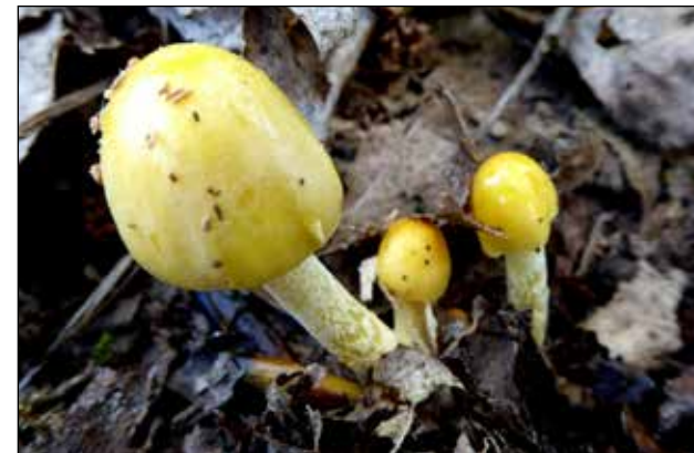
Dooiergele mestzwam – Bolbitius titulans Hoed van 1 -5 cm. Kleur heldergeel tot olijfgeel, rand geribd, wordt bij ouderdom roestbruin-geel, steel wit. Voorkomen: op mest van koeien en paarden en bemeste grond, o.a. weilanden.