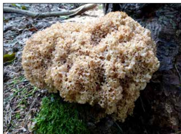
Grote sponszwam – Sparassis crispa Kan 10 tot 40 cm groot worden, vleeskleurig tot okergeelachtig. Kroezige bladachtige elementen, nogal broos. Stronk witachtig. Komt voor aan de voet van levende naaldbomen.