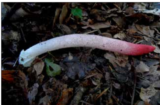
Roze stinkzwam – Mutinus ravenelii Komt als een soort eitje uit de grond en groeit dan vrij snel tot een lengte van 5 tot 8 cm hoog en 1cm dik. De top is roodachtig als de groene sporen eraf gegeten zijn door de vliegen. Komt voor in loof en naaldhout.

Als er belangstelling is om mee te doen met de werkgroep; iedereen is welkom.