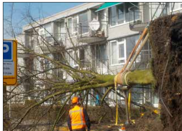
4: de paardenkastanje tussen de St. Petrus-basiliek en het protestants kerkje stond al met één voet in het graf: waarschijnlijk zijn er wortels beschadigd tijdens herbestrating van parkeerplaatsen en plaatsing van nieuwe rioolputten in 2006 gevolgd door een (zorgvuldige) renovatie van de kerkhofmuur.