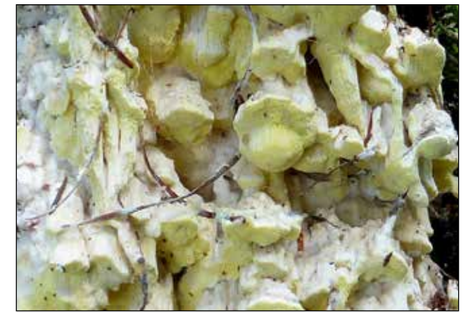
Citroenstrookzwam – Antrodia xanthe Kan plakaten vormen op dood naaldhout of stammetjes. Als het goed gaat vormt hij hoedjes en zijn deze jong citroen geel (vrij zeldzaam, komen hier wel voor).