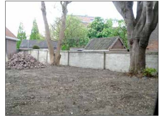
6 en 7: van verhullend struweel naar kale toekomstige parkeerplek met gekandelaberde (zilver)linde in de Clarissenstraat.