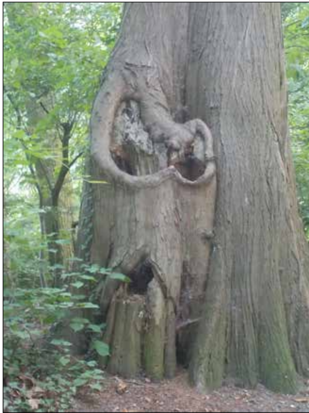
2: een bomenmonster dat deze boom eens zal (doen) vellen (in Park Stapelen).