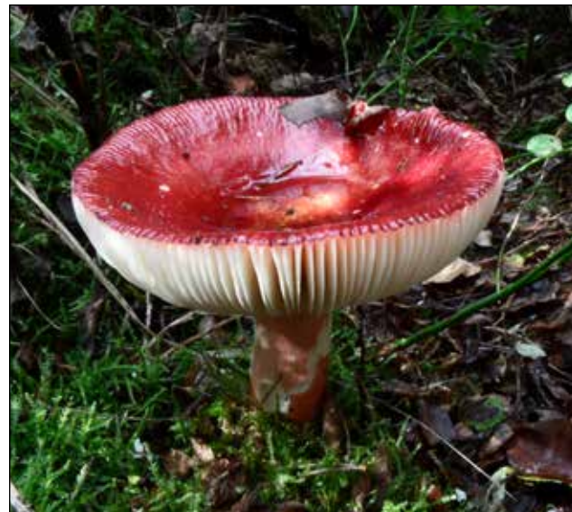
Appelrussula – Russula paludosa De hoed wordt ongeveer 10 cm groot en is rood. De steel is wit met een rode aanslag. Komt voor in vochtige den en fijnpar/lariks opslag. Een rode lijst soort: (Kwetsbaar).