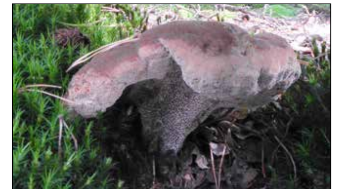
Fluvelige stekelzwam – Hydnellum spongiosipes Alleenstaand of vergroeid voorkomend met vaak een golvende rand. De steel is bezet met stekels, eerst wit en daarna roze bruin. Rode lijst: (Kwetsbaar)