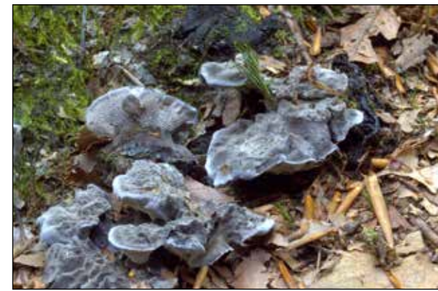
Blauwzwarte stekelzwam – Phellodon Niger Heeft vergroeide hoeden, kleur bruinzwart tot zwart met een blauwe bijkleur. Het oppervlak is viltig en in de jeugd met een blauwe weerschijn. De stekels zijn grijswit. Komt voor in loof- en naaldhoutbossen. Rode lijst soort (bedreigd) en is zeldzaam.