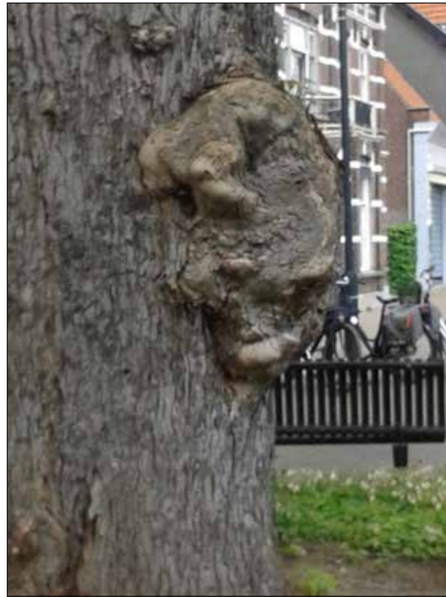
3: een luisterend oor in de esdoorn bij de Rabo-bank, ook bedreigd met kap.