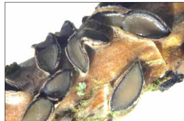
Eikenspleetlip – Colpoma quercinus Vormt zich onder de schors van een eikentakje, bij rijpingen vocht scheurt de schors en komt het vruchtlichaam tevoorschijn.